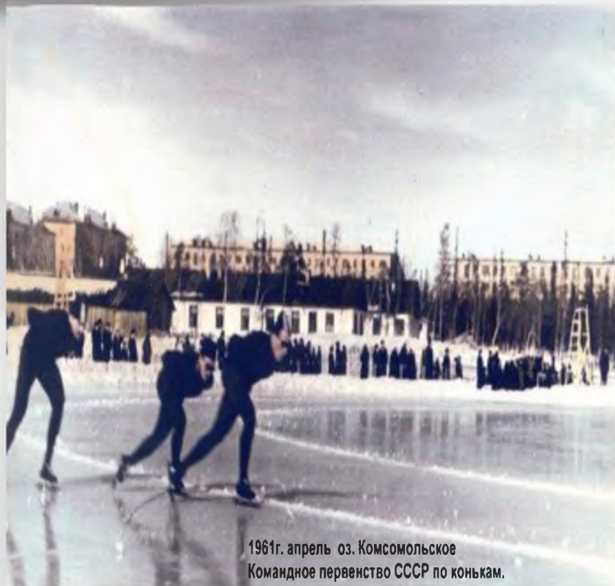
1961г. апрель оз. Комсомольское Командное первенство СССР по конькам.

Как называлась опубликованная статья в газете «Мончегорский рабочий»